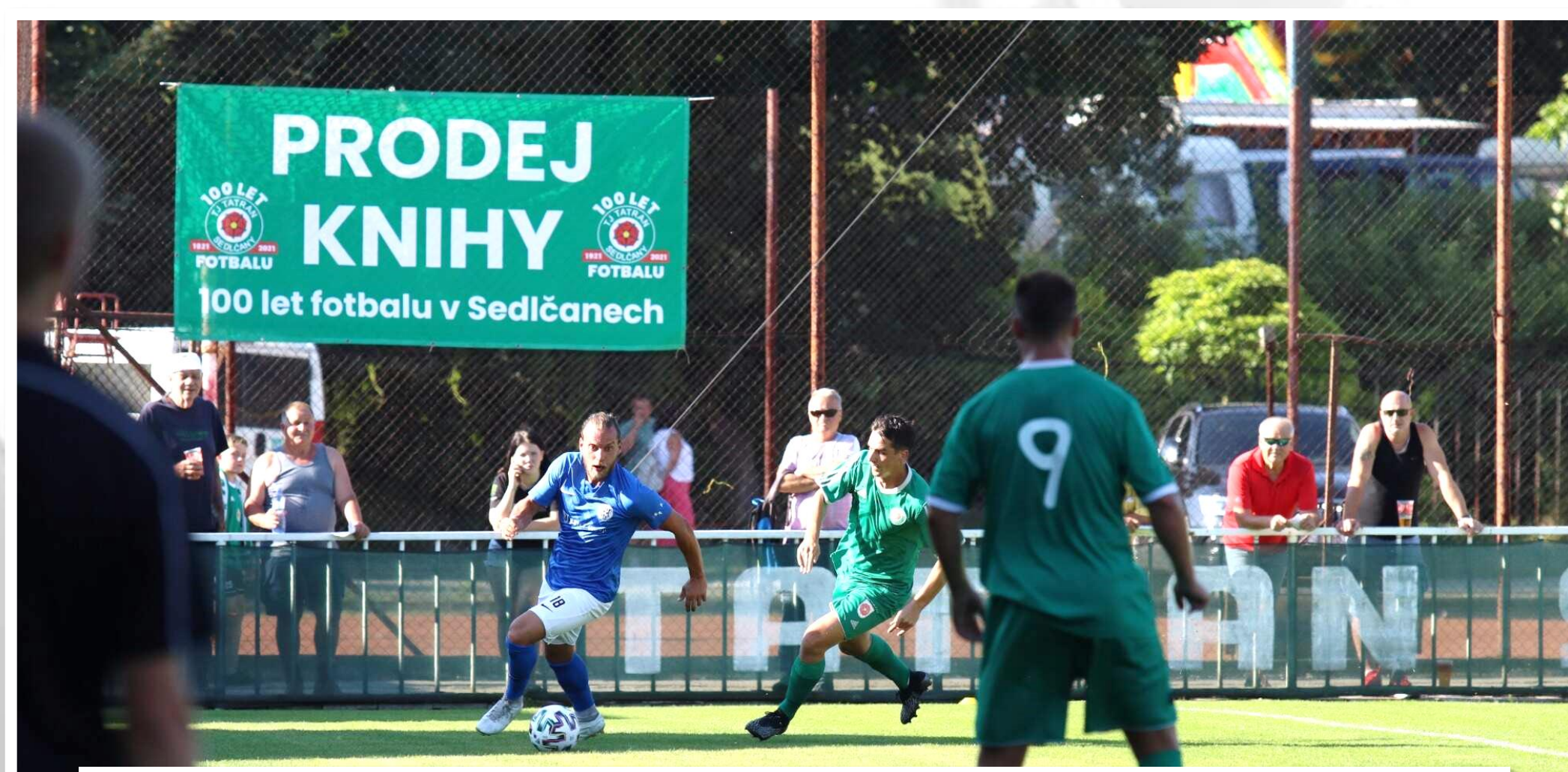
Divizní utkání Tatran Sedlčany – Lom, zahájení prodeje knihy